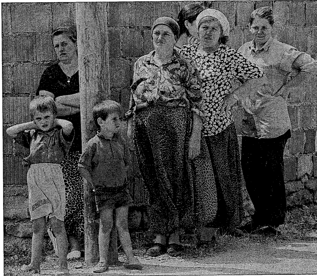
Frauen und Kinder warten im Dorf Labucevo auf humanitäre Hilfe.

Seit zehn Jahren – seit Milosevics Aufstieg zur Macht – tritt das serbische Regime in Kosovo als Fremdherrschaft auf; die Albaner werden als Untertanenvolk behandelt. Die Offensive der serbischen Truppen richtet sich nicht nur gegen die Guerilla, sondern auch gegen die Zivilbevölkerung. Sie bezweckt, mit Zerstörung und Vertreibung die Wirtschaftskraft der Albaner zu schwächen und ihren Widerstand gegen die Unterdrückung zu brechen.